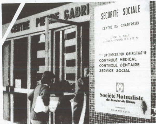
La preuve par l'image de l'intervention ouverte, illégale de la Caisse primaire pour fournir à la Société mutualiste des B.-du-Rh., protégée par le patronat, l'encadrement administratif, le support logistique et le soutien financier, pour mettre à sa disposition des locaux de la Sécurité sociale. Toutes infractions relevées précisément par le rapport de l'I.G.A.S.